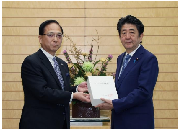
首相官邸HPより転載