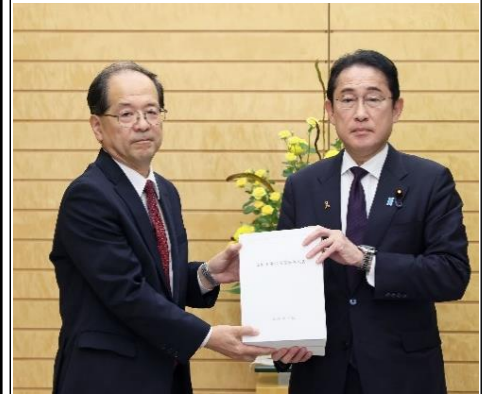
首相官邸HPより転載